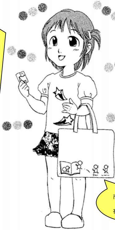
市オリジナル 布 バッグ

多摩市では、健康センターで行なわれる3〜4か月児健康診査時に、2冊の絵本などを、市オリジナルの布バッグに入れて手渡ししています。当日は、ボランティアが絵本を通して心がふれあうきっかけとなるように、絵本の紹介も行なっています。図書館には、この絵本かたりかけ事業でお渡しした布バッグを持って、赤ちゃんや幼児はもちろんのこと、小学生へ成長した子どもたちも来ています。布バッグは、子どもたちと図書館、子どもたちとたくさんのお出合いをつないでいます。