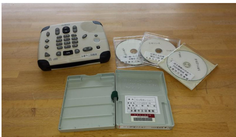
デイジー再生機(プレクストーク)