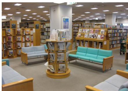
雑誌・新聞コーナー