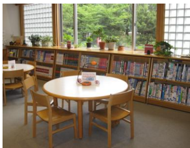
児童用閲覧・調べものスペース