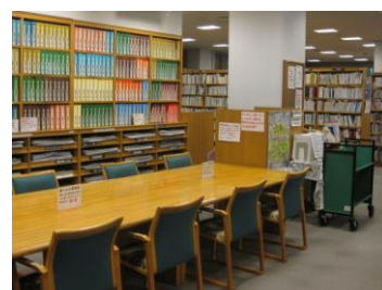
調べもの用閲覧席