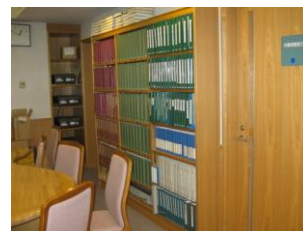
障がい者サービス室