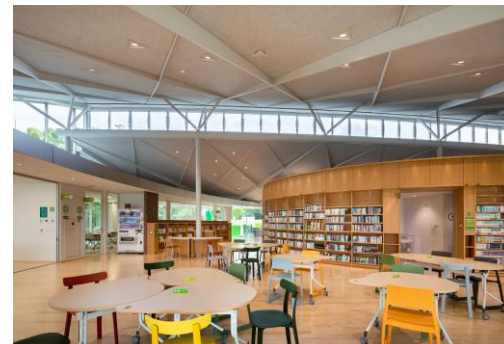
<ラーニングコモンズ>