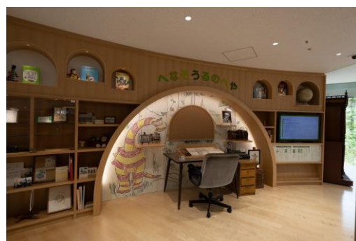
<へなそうるのへや>